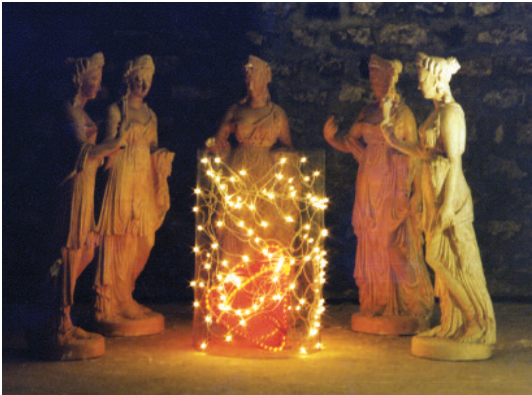
► Porteuse de lumière, une installation de Dominique Doulain à Issy-les-Moulineaux, en 1999