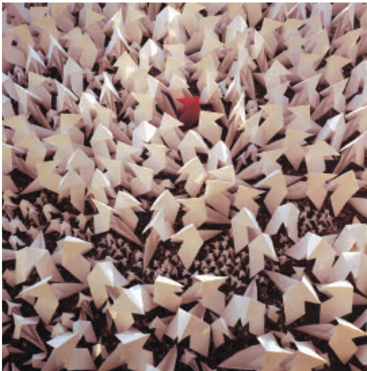
► Te quiero, une installation du plasticien rémois Ismaël Kachtihí del Moral en 2002

la lumière, la faire vivre d'une autre façon, lui porter un autre regard, la valoriser aux yeux des habitants », est un discours qui recoupe parfaitement celui des maires aujourd'hui.